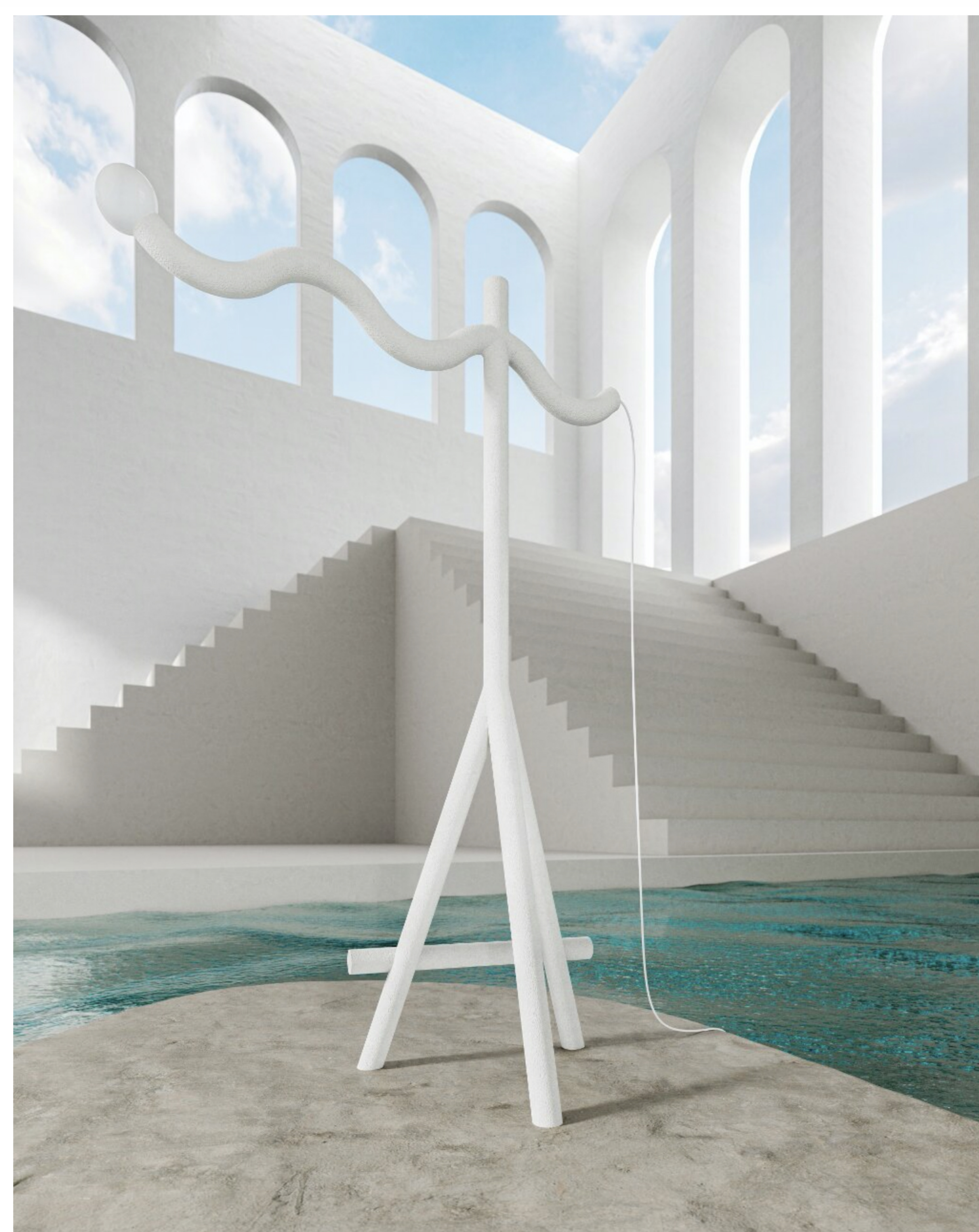
Sicka de Het Vier Estrellas

“Octubre siempre será para nosotros la Dutch Design Week, por eso nos hemos asociado con los artistas visuales Dao Archviz para crear nuestra propia visión de este importante evento.”