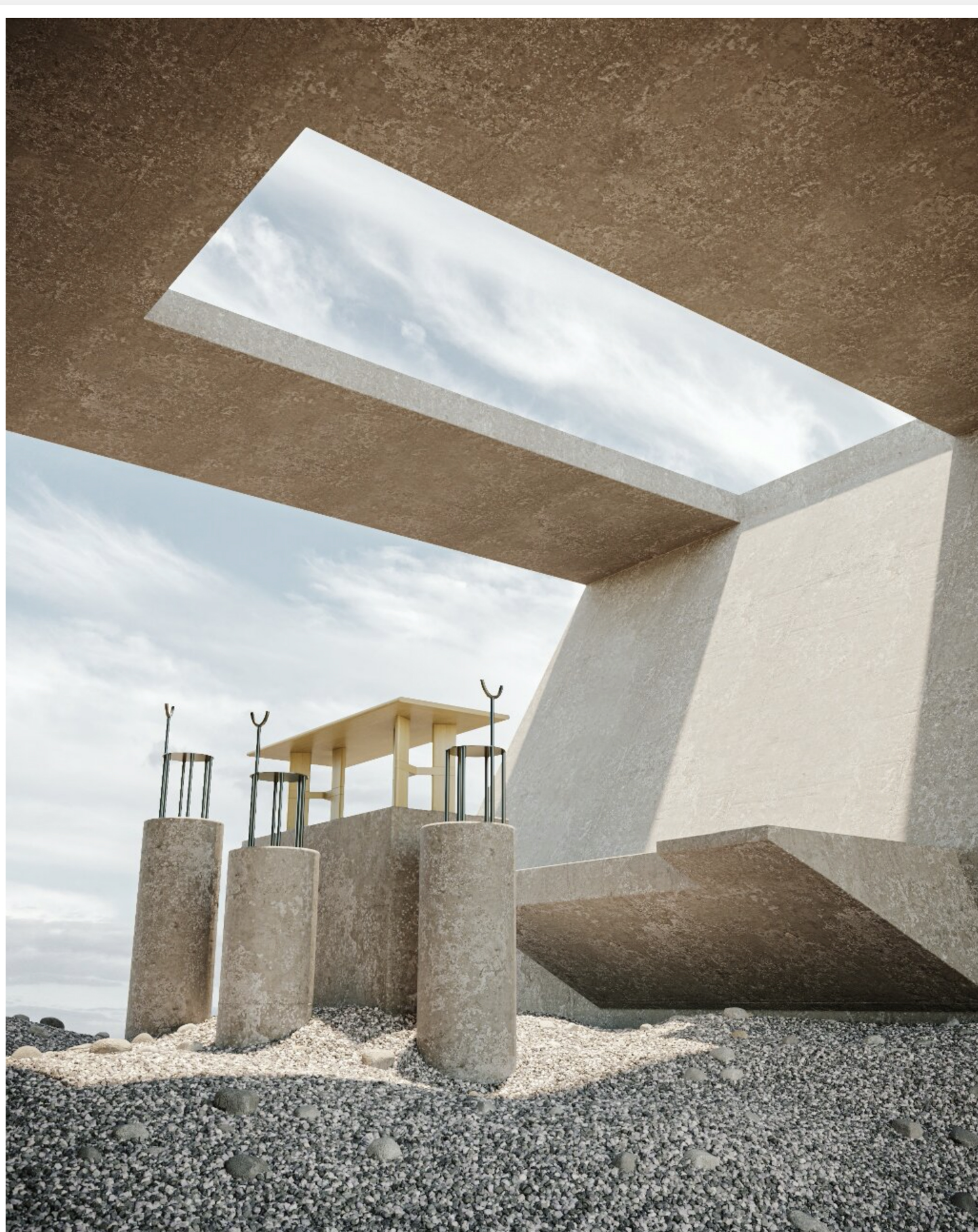
Room para Irregularities Chair by Wale y mesa Elgh by Wengun

Como parte de su función, Movimiento considera un deber el seguir avanzando en toda la escena del diseño, por lo que las piezas de esta exposición virtual son procedentes de diversas partes del mundo, con la participación de diseñadores de Corea, Estados Unidos, Turquía y Escocia, entre otros, ambientados en escenarios extraordinarios de exuberante arquitectura, en una gran variedad de materiales y texturas.