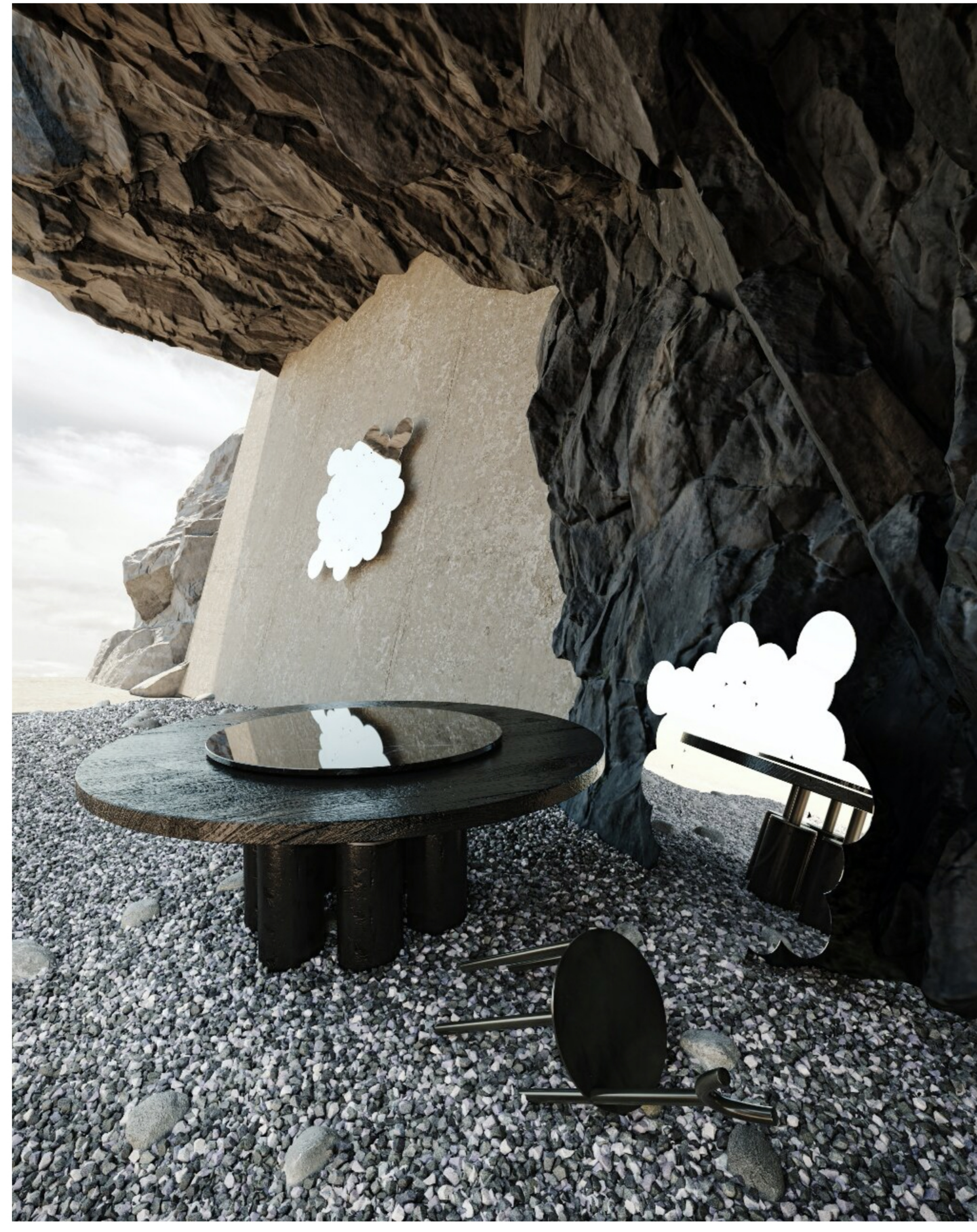
Room para Irregularities Chair by Wale, mesa Mammut by Studio Elife y espejo Kiri Chirno de ASATA

El equipo detrás de Dao Archviz ha creado una serie de escenas con un tema común, el resurgimiento de los escombros. “Todos estamos en una posición en este momento en la que tenemos que superar lo negativo y seguir avanzando, pero en ocasiones nos podemos sentir abrumados, aislados y solos, o bien, atrapados en algún lugar o circunstancia.”